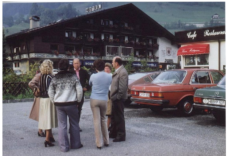
In Bad Kleinkirchheim