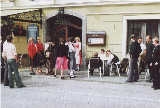
Vorm Hotel Post

In Lungötz im Lungötzerhof wurde noch zu einer kleinen Jause eingekehrt. Gegen Abend erreichten wir ein wenig müde, jedoch zufrieden über den schönen Ausflug wieder den heimatlichen Hafen.