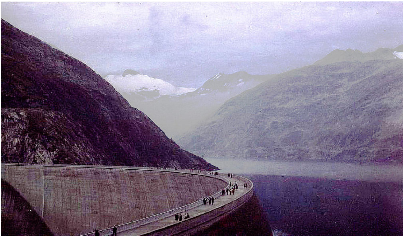
Maltastausee mit der imposanten „Kölnbreinsperre

Wir fuhren bis zur Kölnbreinsperre den höchsten Staudamm Europas und bestaunten dieses imposante Bauwerk. Leider hatte der Wettergott es nicht so gut gemeint mit uns es war ziemlich neblig, aber zu guter letzt zeigte er Erbarmen und öffnete die Nebeldecke und so konnten wir auch noch die umliegende Bergwelt bewundern.